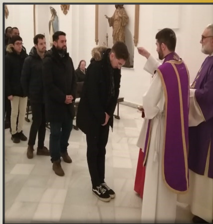
Miércoles de ceniza en Cazalla de la Sierra