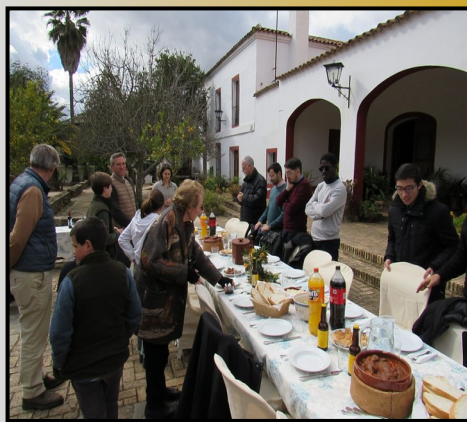
Comida al aire libre en "las Corchas"