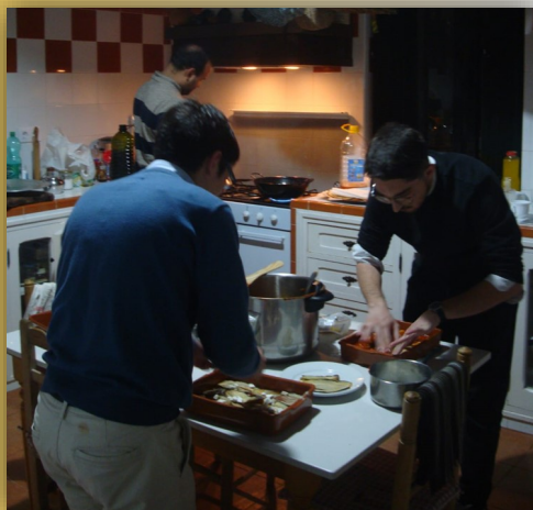
Los seminaristas cocinando

Los días anteriores a la Cuaresma coinciden con el Carnaval de Cádiz. Por este motivo, intentamos salir durante esa época a un ambiente mas tranquilo. Este año, una familia muy querida para nosotros, y muy generosa, nos han dejado su casa en el término municipal de Cazalla de la Sierra, donde hemos pasado unos días descanso, de meditación y de estudio.