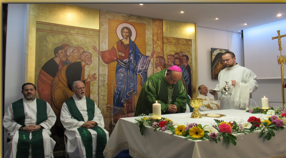
Celebrando la Eucaristía

El 21 de Enero, con motivo de la Visita apostólica a los seminarios de España, recibimos a Mons. Fajardo Bustamante. Durante la jornada además de reunirse con los formadores, seminaristas y hermanos colaboradores, compartimos un rato en común en la comida y celebramos juntos la Eucaristía. También en la cena nos acompañó nuestro obispo Mons. Rafael Zornoza.