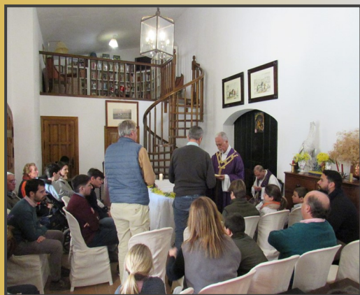
Eucaristía del Domingo I de Cuares- ma